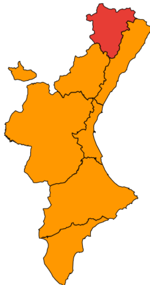
Fig. 2: Mapa niveles preemergencia (colores) Fig. 2: Mapa nivells preemergència (colors)

La información del nivel de preemergencia ante el riesgo de incendios forestales está disponible en www.112cv.gva.es . Queda prohibida la quema de residuos vegetales generados en el entorno agrario o selvícola en terreno forestal y su Zona de Influencia Forestal durante el periodo comprendido entre el 1 de junio y el 15 de octubre , ambos inclusive , salvo que esta actividad se contemple en un plan local de quemas aprobado por el órgano competente en zonas de bajo riesgo, con nivel de preemergencia 1 y hasta las 11 horas como máximo.